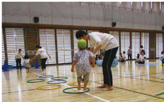
一人ひとりの子どもの成長を見守り、育てる保育士の力は天下一品！温かい気持ちと優しい手でお手伝いしています。

小さな子ども達ですが、日々の生活の中で困難な事に出合っても、悩んだり考えたりすることで、答えを出しながら乗り越えて行く気持ちが育つようにお声掛けをしています。 やってやれない事はない、やらすにできる事はない。