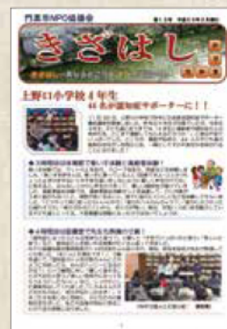
広報紙「きざはし」の発行