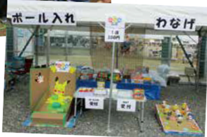
(写真右)市内のイベントにも参加しています。

園外学習や地域の高齢者の方々とのふれあいで学んだり感じたりする事も多く、豊かな気持ちや育つことを願いながら日々過ごしています。 また、市内のイベントに参加し、地域の子ども達にゲームを楽しんでもらっています。子育て中の地域の方々にフラダンス等で、楽しい時間を過ごして頂く「なごみ隊」という子育て支援イベントを不定期で開催しています。