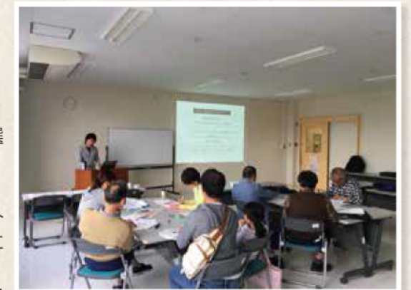
セミナー当日の様子

さらに、「クラウドファンディングを広報に使ってみよう!」というトピックがあり、こちらは資金調達と合わせて、思いや活動の紹介にもつながる発信ツールとして使えます。このセミナーで、今まで知らなかった情報発信方法を、多く学ぶことができました。学んだことを今後に活かしていこうと思います。