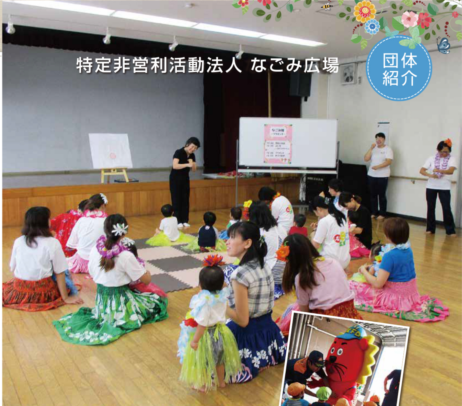
(写真上)「なごみ隊」でみんな楽しくフラダンス

園外学習や地域の高齢者の方々とのふれあいで学んだり感じたりする事も多く、豊かな気持ちや育つことを願いながら日々過ごしています。 また、市内のイベントに参加し、地域の子ども達にゲームを楽しんでもらっています。子育て中の地域の方々にフラダンス等で、楽しい時間を過ごして頂く「なごみ隊」という子育て支援イベントを不定期で開催しています。