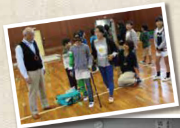
認知症サポーター養成講座の様子