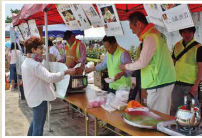
門真市での各種イベント行事への参加風景

市民公益活動支援センターは、「非営利」かつ「不特定多数の利益」となる、市民公益活動をサポートしています。